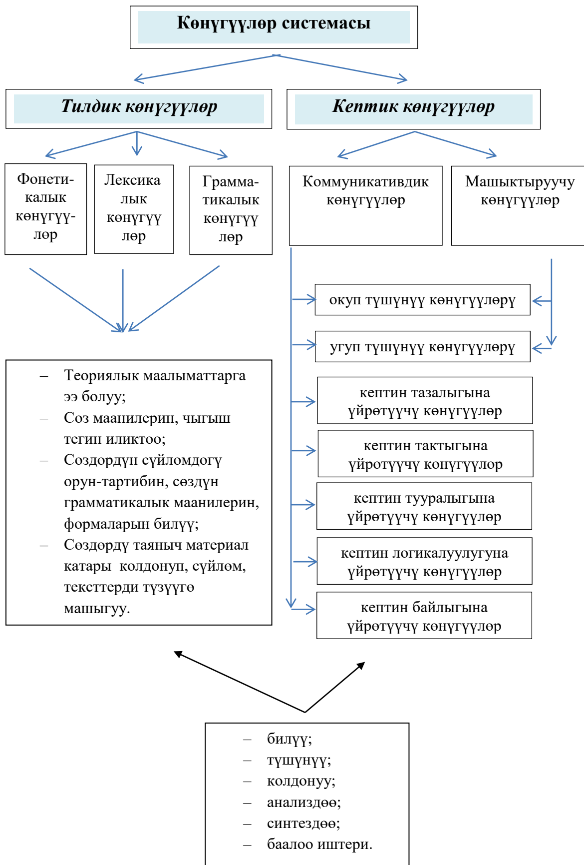
2.1-сүрөт. Окуучуларда кеп маданиятын калыптандыруучу көнүгүүлөр